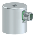
Klemmgehäuse BC 62 (aus PP) und BC 62/L (aus PVDF); Schutzart IP 64