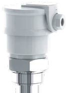
Boîte à bornes BC 62 (en PP) et BC 62/L (en PVDF); protection IP 64