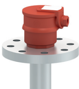
Boîte à bornes B; matériau: acier galvanisé; protection IP 64